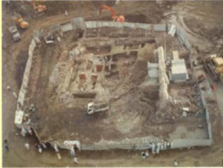
نهو خانووی بیفامپهیری خودا سه لاسی خوای له سهەر بییت ۲۹ سال تیایدا زیاده